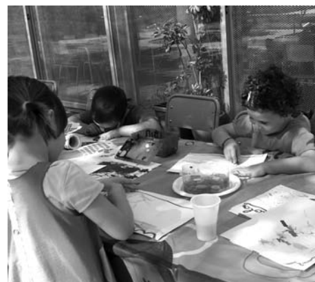
Alumnes fent taller d'arts plàstiques