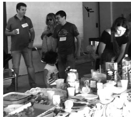
Esmorzar de Benvinguda al pati de l'escola